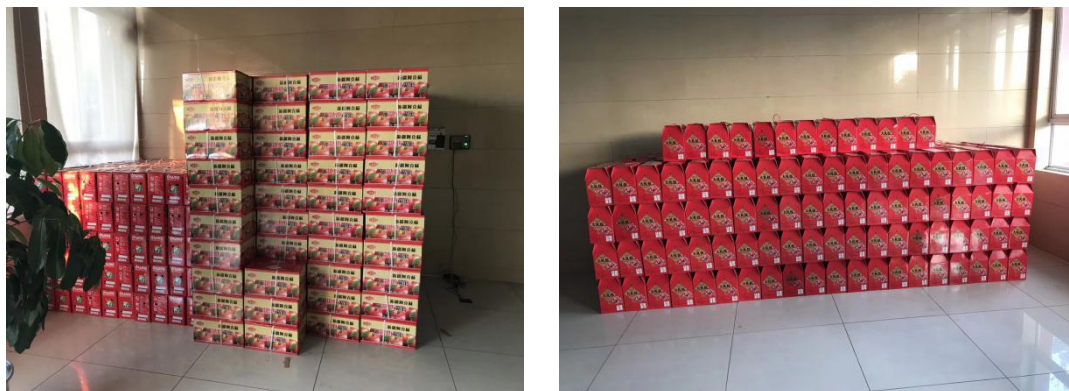
图 3 员工福利多种多样

生日蛋糕、三节礼品、定期聚餐（班长级两个月一次、全体员工一年 2-3 次）等。另老板私人补助困难员工、协助外地员工子女入学、餐补、管理层提供宿舍、通讯补等。