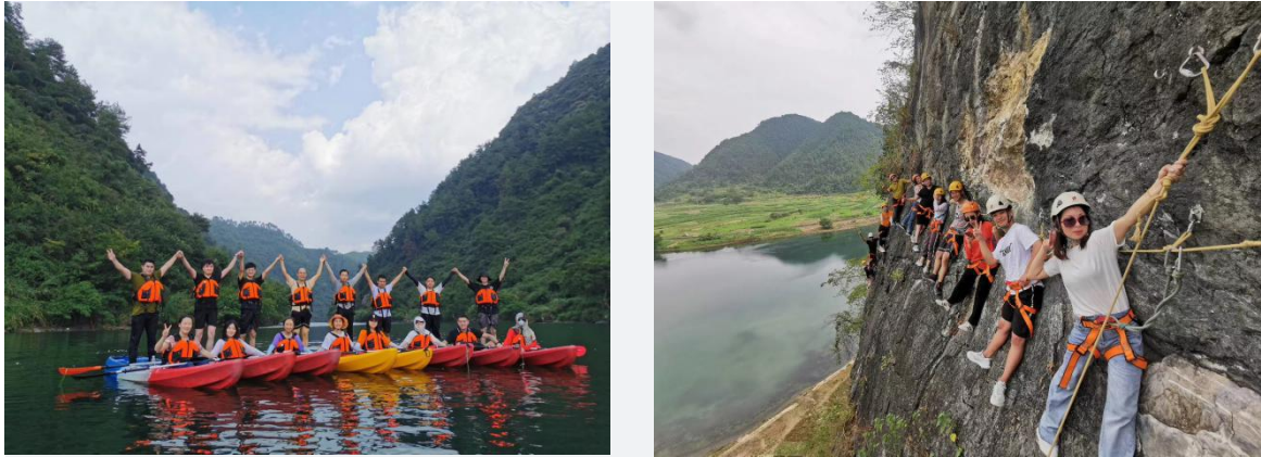
图 4 玛莉莎户外拓展活动

得到了放松，更加大了员工之间的交流，增强了团队的凝聚性和团结力，让员工有了强烈的归属感和责任感，为之后玛莉莎的发展贡献自己的力量。