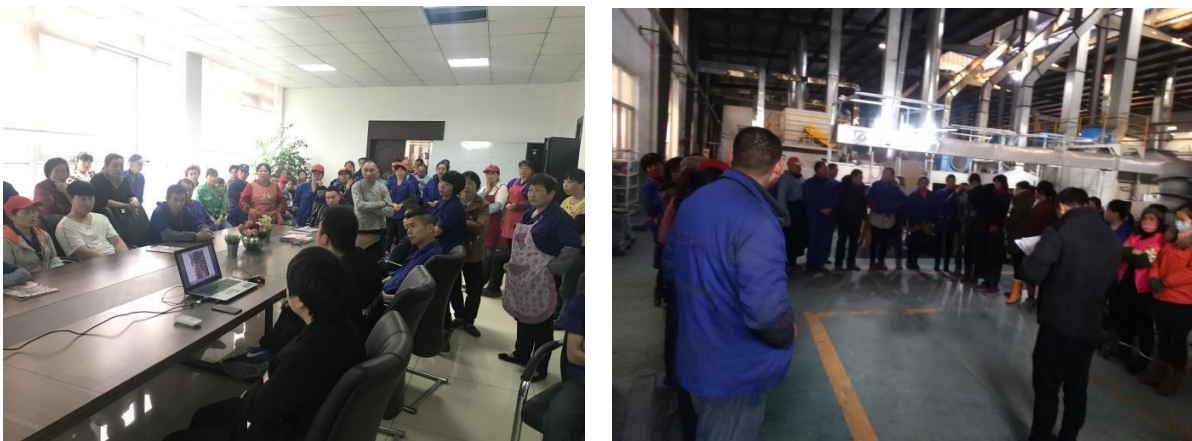
图 2 员工参与培训

2019 年，在公司总经理的领导下，公司全年无死亡、重伤事故。公司加强对各部门的安全管理，并与所有部门签订安全协议，明确责任，落实追责制度。公司开展各类安全教育培训，全年对 35 名新员工进行三级安全教育。公司进行消防安全应急预案演练，真实地演示火灾发生的救援过程，为员工提供应急救援知识；组织消防疏散演习，使员工熟悉了消防通道和疏散门位，掌握了逃生自救方法。