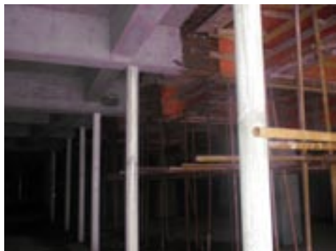
右边为大华公司承建的二期工程，钢管支撑不能拆除状态；左边为浙江城投建设有限公司承建的一期工程，混凝土撑柱换撑并拆除模板后状态。