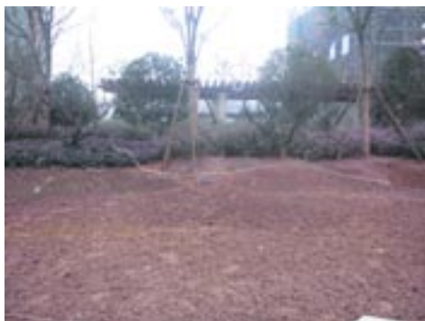
地下顶板景观覆土1500mm后地下室顶板质量完好，无渗漏现象。