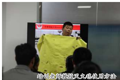
培训师教授灭火器使用方法