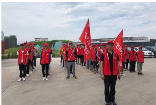
4号台风“黑格比”肆虐永康大地,山洪来势迅猛,激流卷浪,百年不遇,台风过后是满目疮痍,房屋垮塌,道路损毁,农田被淹。洪灾过后,清理重建成为受损村庄的急迫事情。

为了灾民的清理重建,公司提出给与帮助。一声令下,全司积极响应,不到半小时,就有150名员工踊跃报名。