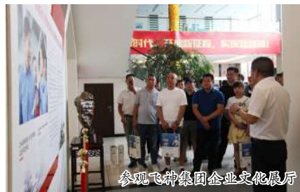
参观飞神集团企业文化展厅