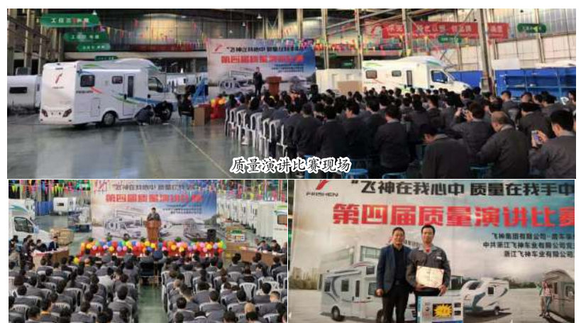
质量演讲比赛现场

调指出,质量是企业生命,产品的灵魂,要种植在每位员工心中,生根发芽。飞神创立的工匠学院,让更多有激情有梦想独具匠心的员工参与进来,打造精品,获得更多消费者信赖;要精雕细琢做好每个环节,不断持续满足客户需求;要以客户为中心,做好产品质量和服务质量。“用心做好车,让用户安心”是我们的宗旨,房车事业部面临着激烈的市场竞争,产品质量提升尤为重要,各部