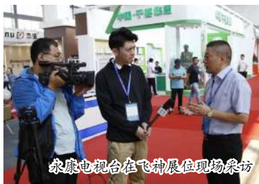
永康电视台在飞神展位现场采访

飞神-中科爱米医疗护理床是今年首次参展博览会。这款由中科院、苏州医科所和飞神集团共同研发制造的新型高科技产品,于今年初研发成功,一经亮相,就以其科学便捷、结构新颖、医护两用的功能特点,广受医疗卫生、康复保健、健康养老及社会各界的关注。人们普遍认为,随着我国老龄化社会的加速到来,此类健康医疗护理产品将会形成极具发展前景的新时代医疗大健康产业,而被各界一致看好。永康市政府也有意将其培育为本土十大产业。各方面的眼光准确热辣,在本届博览会上,当客人们看到飞神这款新颖别致的前卫产品时,立刻