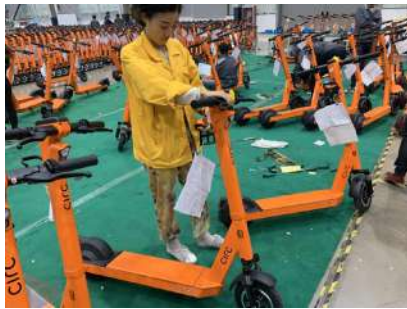
从设计冻结到首批出货,期间客人对产品不断提出改善要求,这对我们的应变处理

此次订单为公司吹响了打入共享滑板车市场的号角,更是飞神作为自主品牌进入共享领域的一个转折点,具有里程碑的意义!自去年开始,公司与欧洲设计团队紧密合作,共同设计研发了这款主要针对欧洲市场的共享滑板车。在经历了单刹,双刹,机械锁,电子锁,IOT升级等等改型换代后,最终定型了目前这款个性与人性并存的共享电动滑板车。