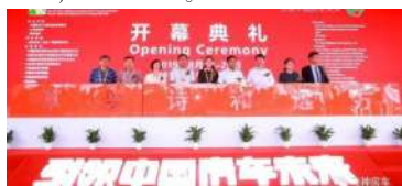
图1:第19届中国(北京)国际房车露营展览会,2019第23届中国国际房车露营大会开幕典礼

8月22-25日,第19届中国(北京)国际房车露营展览会在北京房车博览中心隆重展出,飞神绿精灵款-希尔福房车惊艳亮相展会,引好评不断。