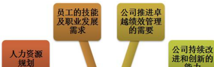
培训需求调查方法一览表