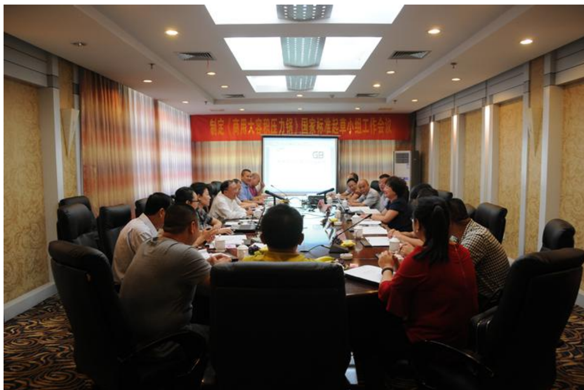
商用大容量压力锅国家标准独家起草单位