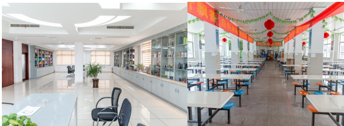
图表 3 良好的工作环境

公司参照 ISO 14001 标准的要求，对工作场所的环境因素进行识别，并采取相应的防护措施。公司每年还举行多种活动，让员工参与安全环境改善工作。