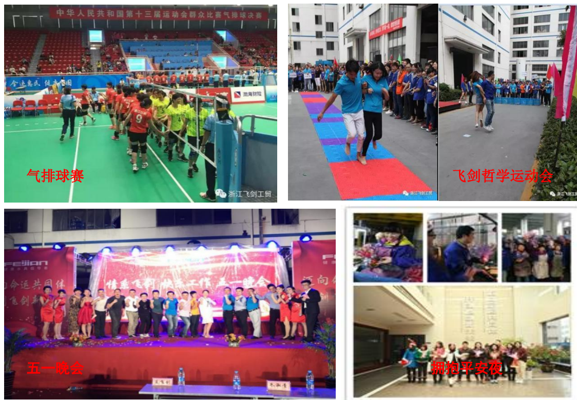
图表 6 员工活动

公司高层领导通过短信/微信平台、合理化建议、员工满意度调查、员工座谈会、下基层参加部门例会、娱乐活动、员工邮件、午餐会等形式，调查、了解员工意见和建议，获取员工满意度信息。明确的问题由行政部负责跟踪督办，要求各相关职能部门在规定时间内进行处理。高层领导注重现场了解情况并在承诺时间内及时做出积极的反馈和处理。