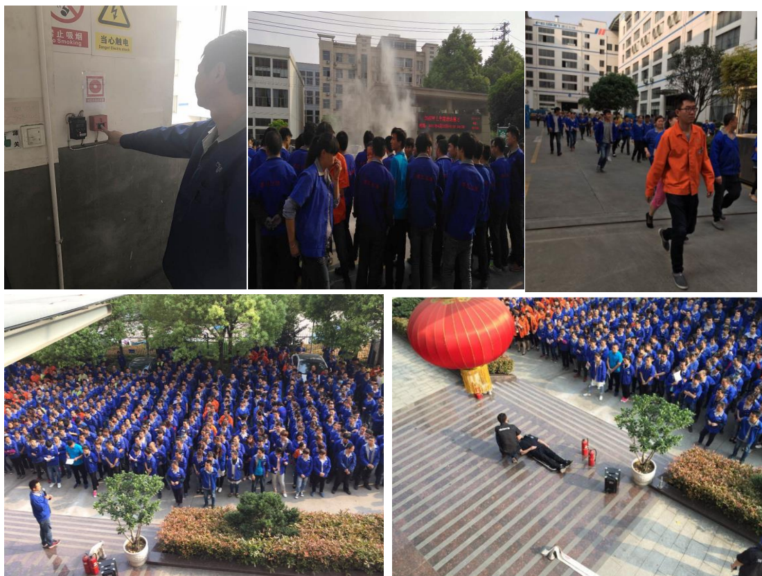
图表 11 公司消防演练