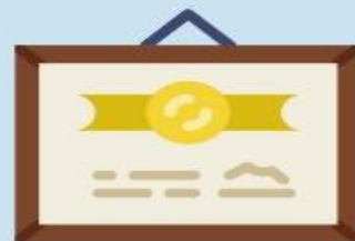
利用和综合经营许可证