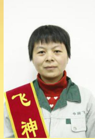
童车 孙 稳