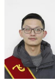
总部 朱 胜