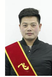
总部 汤 汉