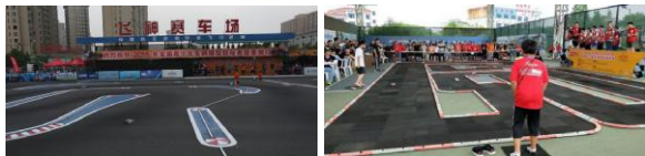
图为1:12电动平路车竞速赛和飞神1-18电动房车竞速赛