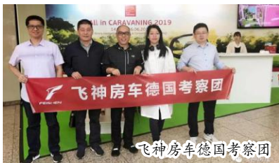
飞神房车德国考察团

杜塞尔多夫房车展集中展示年度最新产品，制造技术，设计趋势，房车商务，旅游和服务设备以及配套产品。“At home, Anywhere”，享受自由和随性——这就是房车度假的魅力所在。在 CARAVAN SALON，来自全球的房车爱好者和从业者将获得九天的独特体验；超过600家参展商，带来130多个品牌，将展示2,100余台旅居车及房车。此外，观众还将像往年一样，在18个展厅及户外展场上找到各类创新的配件、可拆卸零部件、帐篷、移动房屋、露营地及旅游目的地等产品。