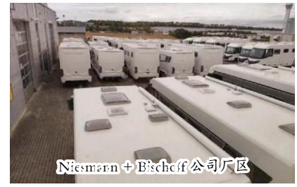
Niesmann + Bischoff 公司厂区

该公司是一家有近五十年历史的德国房车生产企业，专注高端自行式房车领域，从设计到销售各个环节严格把关，质量上乘，高端奢华，使用寿命长而享有盛誉。1996年被 Hymer 房车集团购入麾下。