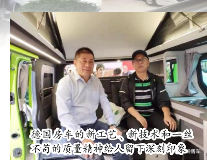
德国房车的新工艺、新技术和一丝不苟的质量精神给人留下深刻印象

参观了杜塞尔多夫国际房车展之后，我们又来到了位于科布伦茨的 Niesmann + Bischoff (尼斯曼-比绍夫) 自行式房车工厂考察交流。