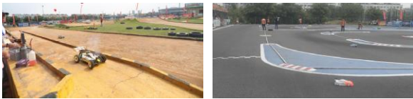
图为1:8油动越野车竞速赛和1:10电动房车竞速赛