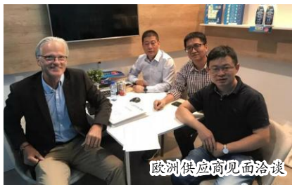
欧洲供应商见面洽谈

参观了杜塞尔多夫国际房车展之后，我们又来到了位于科布伦茨的 Niesmann + Bischoff (尼斯曼-比绍夫) 自行式房车工厂考察交流。