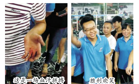
这是一场血汗拼搏

这场比赛虽然只是代步车事业部繁忙产线的一个小插曲,却使参与比赛的人员以及围观的员工增强了竞争意识,同时也给员工在枯燥的工作之余平添了一份趣味和快乐。我们深信,劳动创造是光荣的!工作着是美丽的! (文伟)