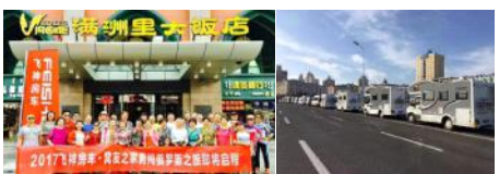
飞神房车远征俄罗斯

作为业界后起之秀,这几年飞神房车在用户群的口碑和关注度都是很高的。经常会有飞神的车友进行网络直播,在全国各地风景旖旎的地方,在世界各地飞神车友远征的地方,比如俄罗斯、欧洲和澳洲等,到处都有飞神房车的靓丽身影和神奇传说。