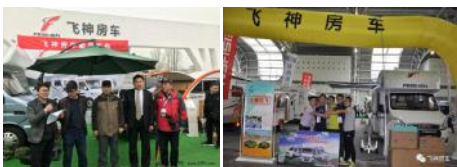
飞神房车亮相北京国际房车展

如今,在全国范围内的房车车友、露营和户外爱好者,或者是关注房车发展的媒体人和网友中间,你可以经常听到对飞神房车相当不错的评价:“飞神房车-中国房车的黑马!”、“飞神房车造型不错,性价比不错,非常有特色!”