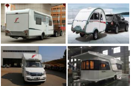
飞神房车部分产品

2016年,飞神房车内外销205辆,2017年前8个月销量比去年全年增长30%,发展势头十分强劲。这个数据与大型改装厂和专用车厂家对比,也许并不吸人眼球,但须知目前房车在国内尚属小众产品,在全国的房车生产企业中,这个数据已属经营和效率都比较高的上游企业。