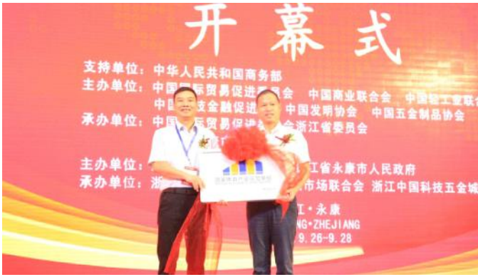
在刚刚召开的中国五金博览会上，飞神获授“国家体育产业示范单位”殊荣。

2017年9月26日上午，第22届中国五金博览会、浙江省第四届省外浙商市场采购浙货对接会在永康市国际会展中心盛大开幕，国家总局、浙江省、金华市、永康市有关领导，有关部门、行业协会负责人，以及来自国内外的数万嘉宾商贾参加了开幕式。