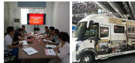
飞神房车参观考察德国杜尚房车展

房车露营产业发展前景广阔,市场潜力巨大,但目前我国的房车市场和文化还处于起步普及阶段,中国房车产业的发展,房车制造与发达国家接轨的产业化、标准化进程,离不开所有房车企业、每一位房车业界人士、媒体、广大房车露营爱好者,乃至立法者的推动,因此,飞神房车还有很长的路要走。