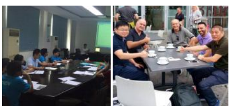
程序文件贯彻培训 通过技术标准一致性检查

目前,关键零部件供应商共有81家。关键工序的制造过程采用在线检查方式进行控制,在线检查记录完整;检查环节应用“五检制”,即员工自检、班长互检和质检员专检、巡检、首检相结合,关键工序专检比率为100%;出现产品不一致时,根据《不合格品控制程序》和《数据分析控制程序》相关流程进行反馈、评审及处置,建立关键工序不合格处置台帐,便于分析和追溯。