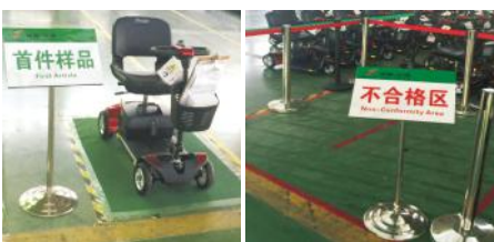
首件样品区 不合格品区