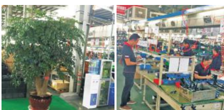
现场四线配水杯消毒柜 流水线班长配备平板电脑、移动办公