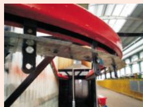
新的喷塑流水线挂钩

童车事业部利用生产淡季对生产车间、设备、厂区基础设施等进行改造,提高厂区的利用空间,提高生产效率,改善厂区环境。 (陈昭育)