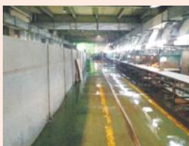
组织人员进行车间地面清洗