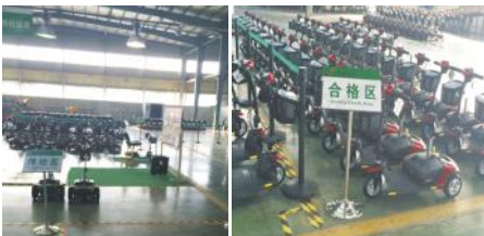
待检区、待检区 合格品区域

(五)根据第 121 号提案:石伟所提生产现场划分要精细的建议,代步车部对生产现场重新进行规划,对区进行标识。