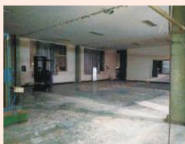
原打样室拆除准备当模具房