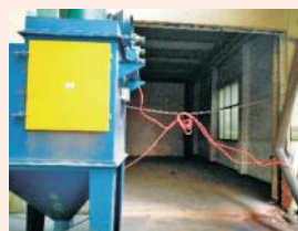
墙体打通,抛光组搬迁至里面