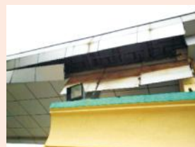
改造后东门广告牌