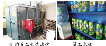
新购置工业热洁炉 员工水杯

(十)根据车间数位员工改善车间工作环境的建议:在前期对注塑车间抛丸机吸尘设备及电焊车间吸烟管道的改造后,注塑车间又新增抛丸机及除尘设备一套,对老的火烧房进行改造,购置工业热洁炉,提高生产效率,又符合环保要求,减少了烟尘粉尘的扩散,减少排放,改善厂区环境,工作环境。装配厂及车架厂员工发放水杯并做好标记,车间形象有所提升。