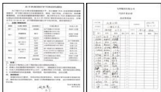
培训通知 培训签到表

(一)根据第 51 号提案:应贤林所提关于推广品质问题自查自纠行动的建议。代步车事业部从第 34 周开始,每周制订培训计划,周五下午 15:30 改善专题会议,针对拆车车型中,发现的一些问题,进行讨论,责任到人,落实整改。目前已对量产车型,总装下线后,都已拆车核对资料后,将问题整理汇总,进行整改。后续将对已包装完检的车,进行自查自纠。