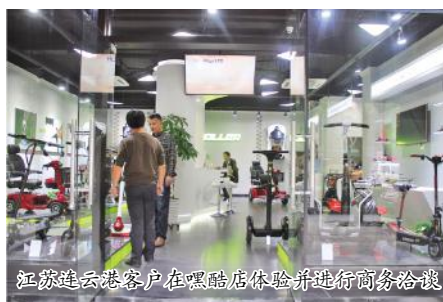
江苏连云港客户在嘿酷店体验并进行商务洽谈