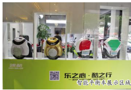
乐之心·酷之行 智能平衡车展示区域