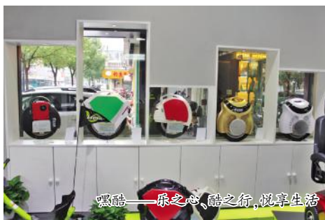
嘿酷——乐之心、酷之行,悦享生活