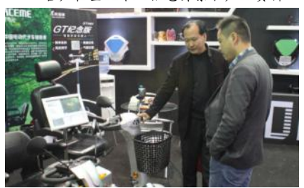
客户在咨询老年智能代步车的代理政策

韩国男神、明星战略、体育营销……都不敌产品为王,电动车天津展最大的体会就是这个,现场不仅明星多、大腕多、美女更是如云,其中雅迪、爱玛展位的众多性感美女模特争先试驾并体验奥捷骑产品,让原来人山人海的奥捷骑展馆变得更加寸步难行。