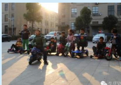
个性年代,谁与争锋