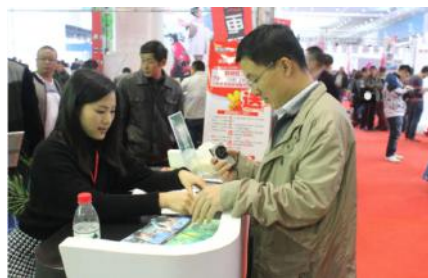
客户在登记个人信息并索取产品资料

备如此炫酷的几大功能,奥捷骑一直持续为消费者提供绿色、节能、环保的智能移动代步工具而不懈创新。本次盛会,我们带来了自己研发并生产的智能平衡车、电动滑板车、老年智能代步车、电动ATV等产品,产品涵盖了儿童、青年和老年人等群体。由于奥捷骑产品的独特性和细分化,展会现场吸引了众多客户前来咨询代理政策及产品性能,众多客户纷纷有意向代理奥捷骑产品。