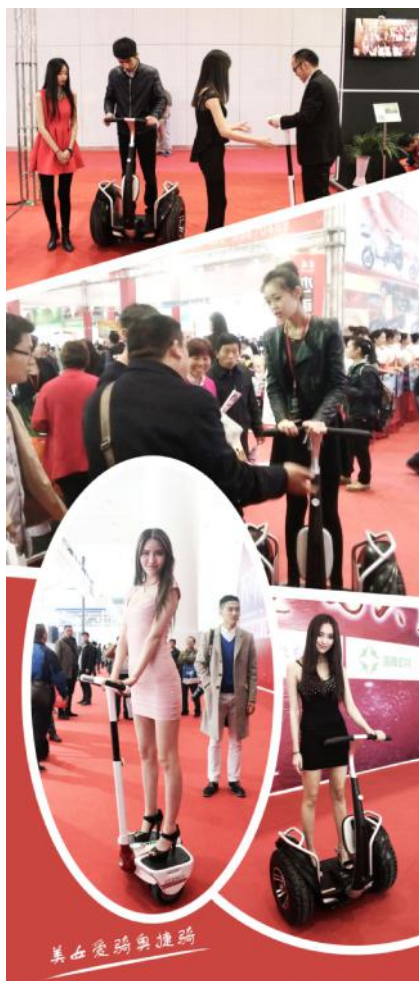
各路男神美女试驾并体验奥捷骑产品

相信,无论新老朋友,在天津展这一年一度难得的行业盛会上,各企业都会异彩飞扬,“八仙过海、各显神通”,第十五届天津展会让属于展会的三月画上圆满句号,同时也会让这个春天更加丰满。(李阳)