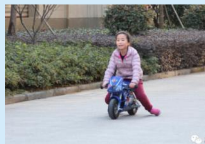
清纯小妹也可以很拉风的,有木有?