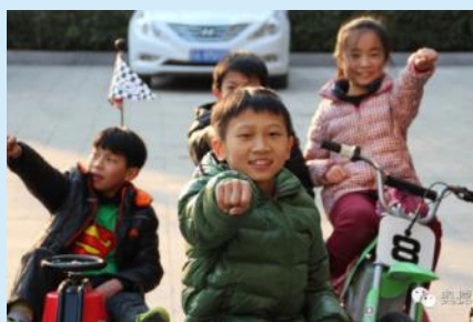
这个冬季不太冷,你造吗?奥捷骑的小伙伴们个个都很欢~!

一群00后小朋友在奥捷骑开心快乐的度过了难忘的一天,带给我们太多的快乐与喜悦,这种久违的快乐一下子仿佛回到了小时候,简单而又单纯的游戏,却带来了最真诚/最简单的快乐,愿这群小朋友们永远开心!