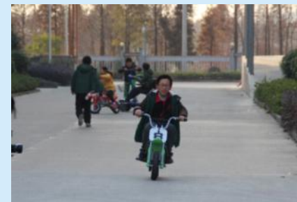
哥不信追不到你,妹子等我!