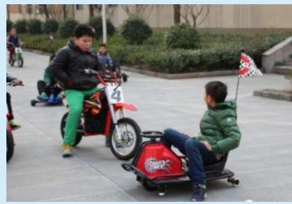
玩这东西还真不是一般人能会的,没见过吧! ——小胖哥,你这是在挑衅么?