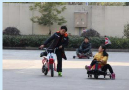
妹子,别笑,哥跟你换车开开!