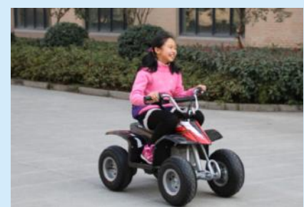
清纯妹子已经乐的两眼只剩1条缝了, ——小哥哥们等等我!