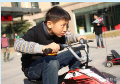
这是ATV吗?好像很霸气的样子