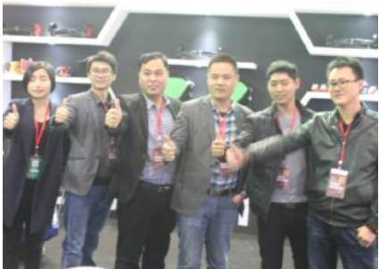
我司强大的参展团队

阳春三月东风暖,“奥客”聚焦天津展。我司奥捷骑作为组委会唯一指定用车品牌参加了一年一度的电动车行业盛会。对于电动车行业来说,三月是忙碌而热闹的,五大展会在一个半月内连续进行,各电动车企业更是大展身手,精彩纷呈。今年天津展格外热闹,展位面积的数量几乎比去年增加了50%,参展商的数量预计增加了三分之一,而参观者更是人流如潮。作为压轴大戏——2015第十五届天津电动车展会更是万众瞩目,万分期盼。